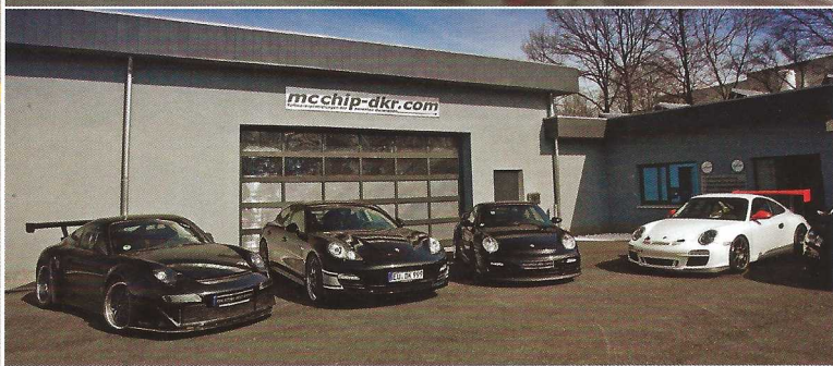
■ MC660 load หนึ่งใน Project มั่นสัจๆ ของ mcchip-dkr จับ C63 AMG มาโมดิฟายเพิ่มกำลังไปจนถึง 660 แรงม้า แต่ยังไม่จบ Project แครนี้ !! ■ ฝูง “เจ้าชายกบ” ที่ผ่านการโมดิฟาย ทั้ง Road Car และ Race Car